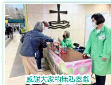
感謝大家的無私奉獻

隨著義工服務逐步恢復，大堂募捐站也於4月全面重開。在此，除要感謝各位捐款的病人與訪客外，更要多謝每一位風雨不改回院當值的義工，你們的付出，讓基督教聯合醫務協會的社區基層健康服務籌得的經費可以造福傷病。