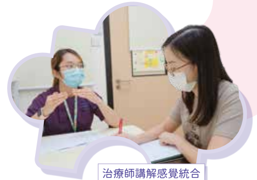
治療師講解感覺統合失調症的相關資訊

答 有遺傳基因引致，亦有與生產因素有關，例如屬早產嬰兒、出生時體重過低（少於2.2kg）或孕婦是否有受酒精及藥物影響；此外，也有環境因素影響，如孩子成長的環境中欠缺玩伴、甚少接觸外界等。甚至有文獻顯示，幼童若在日常生活中經常接觸化學物質，也會增加患上感覺統合失調的機會。