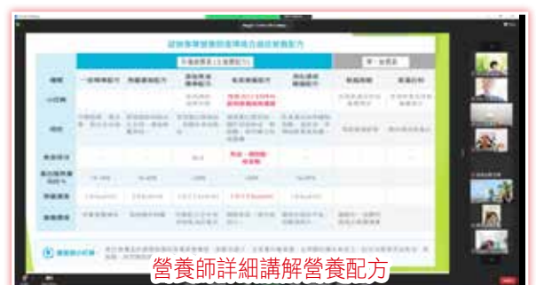
營養師詳細講解營養配方

本中心將於20/7(四)再次舉辦癌症專題網上講座，並邀請本院腫瘤科主管關仲江顧問醫生作主講嘉賓，簡介癌症治療新趨勢，並剖析現時本地的應用情況，大家萬勿錯過。