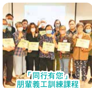
「同行有您」朋輩義工訓練課程