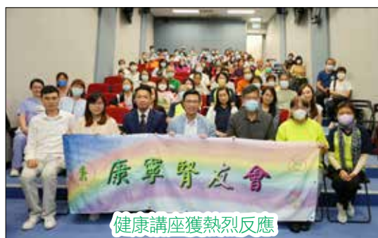
健康講座獲熱烈反應

本會2023-2024年度會員大會緊接講座後舉行，議程包括去年度會務及財務報告、來年本會活動計劃及進行幹事會換屆改選。當日本會幹事、會員、義工及兩院醫護接近100人出席，場面熱鬧。