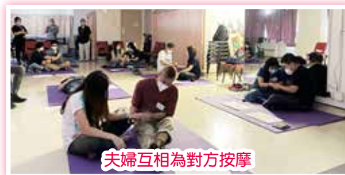
夫婦互相為對方按摩

本中心繼續與本院兒童及青少年精神科及院牧部合作，於 4 月尾開始展開為期 3 個月的 ADHD 家長之親職聯盟體驗小組 (第二期)，透過講解、討論和體驗活動，讓夫婦能成為親職上最合拍的伙伴，並加強參加者之間的朋輩支援。參加者都樂意分享自己家庭的情況及在照顧孩子時面對的困難，彼此交流、學習及互相勉勵。