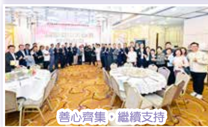
善心齊集·繼續支持