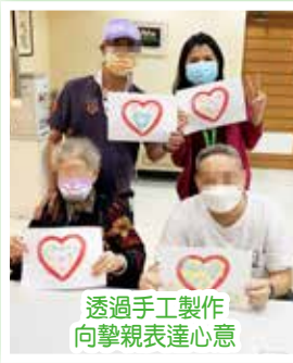
透過手工製作向摯親表達心意

為提供平台予紓緩科患者了解自己的身心需要及紓緩因病患帶來的負面情緒，健康資源中心社工每星期三或四會於本院 14B 日間中心舉行心理社交支援小組，透過不同主題的活動，鼓勵參加者分享病患經歷及感受。過程中，社工了解及關心他們的身心需要，更鼓勵患者之間分享及交流，互相鼓勵，達致「同路人」互相支援的果效。