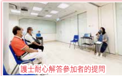
護士耐心解答參加者的提問

中心再次與伊利沙伯醫院病人資源中心及香港癌症基金會服務中心(黃大仙)合作，一連兩星期舉辦「前線加油站」之第四期前列腺癌患者分享會，讓一眾癌症病人和照顧者可以面對面的形式交流和互動。參加者投入地分享治療情況及副作用，癌症基金會護士詳細地解答他們的問題，以釋除心中的疑慮。中心社工借用「苦惱溫度計」，鼓勵參加者訴說自己困擾，大家亦分享自己如何面對這些擔憂，「同路人」之間彼此支持，一起學習與「癌」共存。