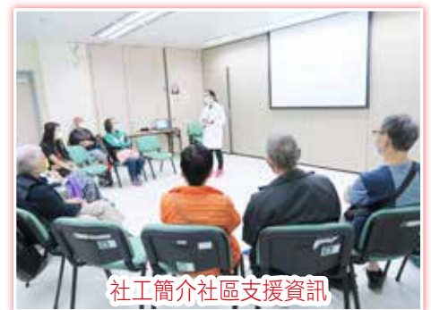
社工簡介社區支援資訊

有見及此，中心與將軍澳醫院外科部及健康資源中心於16/5(二)舉辦了腸樂之道新症適應課程。除了由護師講解手術前及後的護理須知外，中心社工亦提供即時情緒支援給新症患者及照顧者，並提供社區支援資訊，以減輕他們的擔憂。