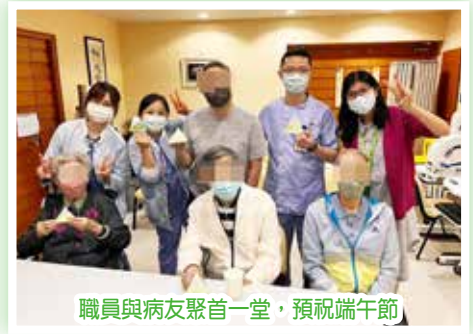
職員與病友聚首一堂，預祝端午節