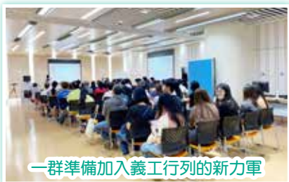
一群準備加入義工行列的新力軍

隨著義工服務恢復，為配合服務需要而招募新義工加入醫院義工服務，本部於27/5(六)、11/6(日)及24/6(六)舉行義工核心課程，安排本聯網新義工參加。義工們在課程前認為學習與病人溝通的技巧便足夠，但經過核心課程訓練後，他們明白原來認識醫院防感染、病人私隱、防火及職安健等知識對參與醫院義工服務都很重要。