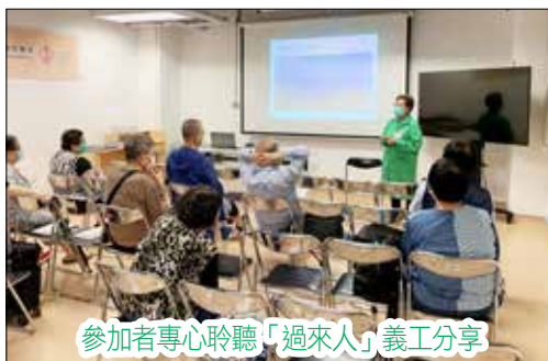
參加者專心聆聽「過來人」義工分享

另外，20/4 (四)小組進行了本年度第一次術後重聚日，為已完成手術的患者及家屬提供平台，分享術後的情況及日常護理技巧。不少參加者感謝「過來人」義工的鼓勵，明白繼續復康運動的重要性；也有參加者覺得中心社工提供的網上資源十分實用，能加強自己對術後護理的信心。