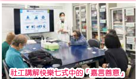
社工講解快樂七式中的「嘉言善意」

中心與本院精神科日間醫院在 4 至 5 月期間舉辦快樂人生小組，旨在通過正向心理學的「快樂七式」，幫助參加者建立積極正面的心態，提升生活質素。小組透過討論、短片、遊戲和練習，例如每日填寫感恩日記、向家人寫一張感謝卡、朗讀自我肯定句子等，讓參加者學習提高生活幸福感的方法，並且融入到日常生活之中。病友更在小組中互相交流，與其他人分享自己實踐快樂七式時的經驗和想法，彼此支持和鼓勵。