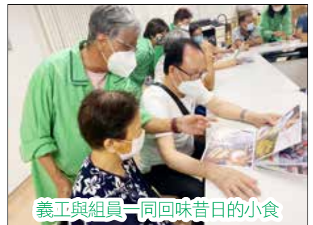
義工與組員一同回味昔日的小食

每當組員「想當年」時都會很興奮，小組於30/5(二)特邀請香港紅十字會合辦「懷舊小食」活動，透過圖片分享及遊戲，與組員一同回味昔日的小食。義工們與組員觀看小食圖片時，聽到很多組員回應「以前經常會食砵仔糕、我好喜歡食白糖糕、現在已經無得食……」整個活動室都充滿笑聲。而在遊戲環節，大家很投入參與，並落力地搶答，贏取小禮物，最後義工們亦將親手製作的手工藝禮物送給每位組員，大家都非常感謝義工們的心意。