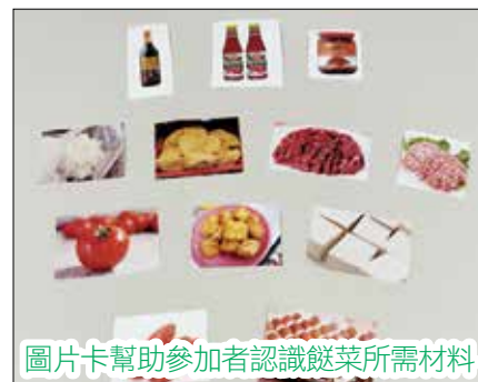
圖片卡幫助參加者認識餸菜所需材料