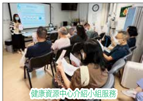
健康資源中心介紹小組服務

今年，香港糖尿聯會以「防疫·『傳疫』·大流行」為主題，假香港科學園舉辦「關注糖尿人士會議」，本會當然積極響應。當日活動內容豐富，除有多項與糖尿病患息息相關的專題講座外，會場更設有多個攤位，透過介紹及遊戲增加參加者對病患的關注。最後，本會多位組員更獲大會頒發「控糖達人」獎項，鼓勵大家在生活上積極面對病患，為自己的健康繼續努力。