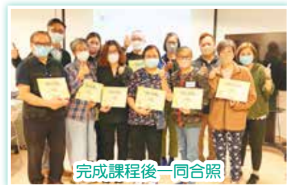
完成課程後一同合照

病友們在課程中，分享自己患病初期的心情及在康復路上的心態轉化，而其中一位病友更無私地分享所面對艱難的復康路，大家不僅深受感動並表示欣賞他的堅毅鬥志，更視他為一個值得學習的榜樣。經過訓練後，各朋輩義工將投入病人支援小組關懷病人的服務。