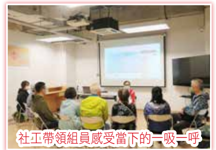
社工帶領組員感受當下的一吸一呼

中心自2019年開始舉辦靜觀治療小組，小組以開放形式舉行，讓新症患者按身體狀況隨時參與。小組每節都將靜觀元素帶到日常的生活環節，如靜觀呼吸、靜觀伸展及身體掃描等，希望有助治療中的患者及照顧者調適情緒，提升他們心理抗壓力。