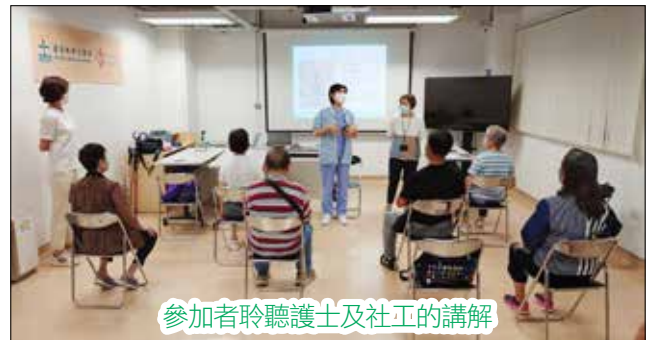
參加者聆聽護士及社工的講解

在課程最後一堂頒發證書予參加者，以作鼓勵。大家都表示課程中除知識上的得著，能夠認識到一班「同坐一條船」的痛症病友，更是很大的收獲。