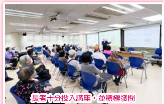
長者十分投入講座，並積極發問

當日活動吸引超過 60 位長者出席，參加者相當投入講座，而且在問答環節中十分踴躍發問。講座完結後，不少參加者均表示講座主題切合長者需要，而且內容豐富，希望日後能舉辦更多同類的活動。