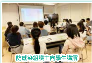
防感染組護士向學生講解

12/6(一)上午安排學生參加迎新日，讓大家認識醫院的服務及環境，並講解義工核心課程內容及有關計劃的安排。午膳後大家隨即到服務崗位投入服務，對於第一個半天的工作，雖然同學們都感到有點戰戰兢兢，但又期待接受新的挑戰。