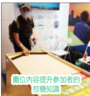
攤位內容提升參加者的控糖知識