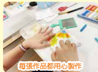
每張作品都用心製作