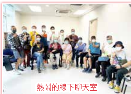
熱鬧的線下聊天室

參加者認為這個活動提供了一個互相學習和支持的平台，讓他們分享患癌的心路歷程、治療過程中的種種挑戰，以及如何克服各種身心上的挑戰。最後，參加者互相鼓勵和支持，祝願每位患者和照顧者對病後的生活更有信心和希望。