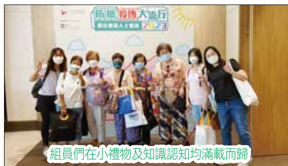
組員們在小禮物及知識認知均滿載而歸