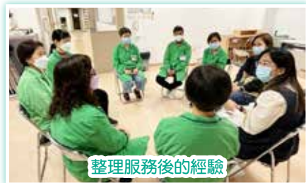
整理服務後的經驗

本院病室探訪義工服務從4月份開始恢復實體進行，綠衣天使義工暫時每月一次到病室關懷住院病人。為了讓義工重拾服務節奏，同時在服務恢復初期更能了解義工的需要，中心社工在每次服務後都會進行服務檢討，並與義工們整理及回顧服務經驗。義工們對於能回到病室重新投入服務感到興奮，遇到昔日的拍檔更是無所不談，互相問候。如你想加入病室探訪義工行列，可與中心職員聯絡。