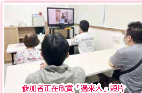
參加者正在欣賞「過來人」短片

為期 12 堂的「復元減壓 360」由本中心與本院精神科日間醫院職業治療部合作，旨在透過介紹復元概念、壓力管理、預防復發等知識和概念，增加參加者對上述题目的認識，從而減少他們在復元路上遇到的困難和壓力。小組更設有「漸進式肌肉練習」、「靜觀練習」、繪畫「和諧粉彩」及「禪繞畫」環節，讓參加者透過不同方法，舒緩生活壓力，保持身心健康。