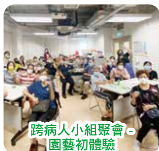
跨病人小組聚會 - 園藝初體驗