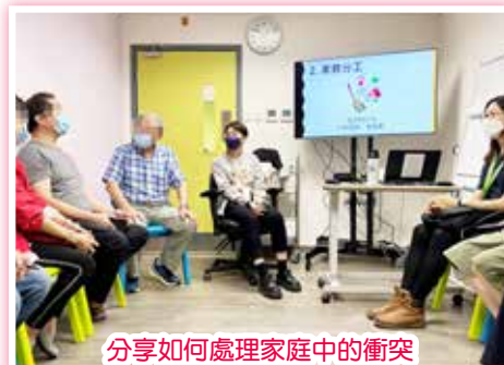
分享如何處理家庭中的衝突

隨著疫情緩和，本中心與本院容鳳書紀念中心精神科日間醫院及浸信會愛羣社會服務處家屬資源及服務中心合作，為精神病患者家屬舉辦一系列專題講座。是次主題圍繞家庭中的衝突處理，照顧者朋輩工作人員分享在日常生活中與家人出現衝突的情形，並提供一些實用的經驗和技巧。參加者亦有參與討論，互相交流自己的看法。其後，社工講解溝通要訣，強調「關係好與壞，在乎溝通與關懷」，鼓勵家屬對病友多欣賞，少批評。