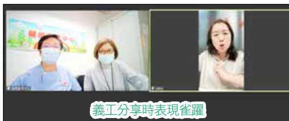
義工分享時表現雀躍

每次「聯合愛嬰網上教室」都有義工經驗分享環節。義工們分享自己照顧新生嬰兒及餵哺母乳的苦與樂，亦為「新手媽媽」提供一些生活小貼士，幫助她們在照顧新生嬰兒及餵哺母乳方面有更好的準備。不少參加者在活動檢討表中回應義工的分享對她們很有幫助。母乳餵哺服務義工一直積極投入推廣母乳餵哺的訊息，實在是醫護人員的合作好夥伴。