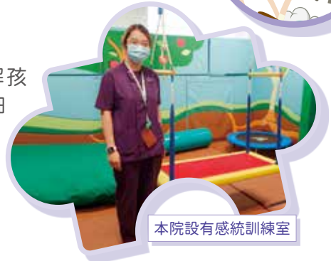
本院設有感統訓練室

答 當接獲醫生轉介後，職業治療師便會約見主要照顧者，了解孩子出現的徵狀及對日常生活的影響，與及透過問卷，較詳細了解孩子近半年的情況。另亦會進行評估及臨床觀察，從每個感覺分析、感覺統合情況、姿勢控制及行為計劃四方面觀察，評估孩子是否有感覺統合失調的問題和訓練的需要。