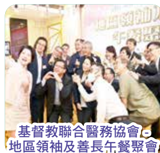
基督教聯合醫務協會 - 地區領袖及善長午餐聚會