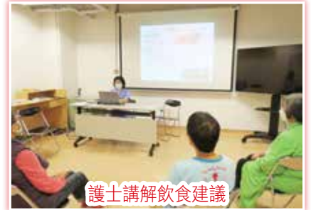
護士講解飲食建議

不少婦科患者在接受手術後對自己的身體狀況、營養飲食或運動方面都有憂慮。因此，中心在 11/5 (四) 舉行了「婦女新姿」火鳳凰新症分享會，婦科護士全面地講解如何調節和適應手術後的生活，以及提供復康運動和飲食建議。及後，病友亦分享自己對未來化療的擔憂。護士提醒化療需注意的事項，以及「過來人」義工分享自身經歷和提供實用建議，藉以加強患者面對病患及治療的信心。