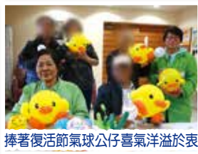
捧著復活節氣球公仔喜氣洋溢於表

透過多元化的小組活動，以輕鬆的手法及以興趣、社交等為專題，讓患者紓緩病患帶來的負面情緒、認識更多「同路人」，在患病路上彼此交流，互相關懷及鼓勵。小組更鼓勵患者家屬一同參與，藉此促進病人與家人間的溝通與聯繫，享受及珍惜更多共聚的時光。