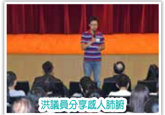
洪議員分享感人肺腑

「聽了醫生，復元人士，學生的分享和看了話劇，《有種經歷叫復元》，確是一個有意義的計劃。經歷本身就是過程，復元需要過程，過程就是時間的付出，用心付出。今天發佈會，我有兩個詞的感受：“認識”和“同行”。