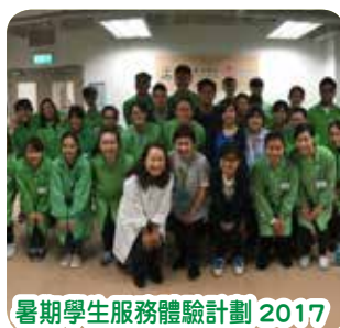
暑期學生服務體驗計劃 2017