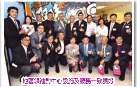
地區領袖對中心設施及服務一致讚好

典禮後，多名青少年大使表演木箱鼓，展現陽光活力的一面，並開放中心予來賓入內參觀。為進一步讓來賓了解中心服務及設施，中心安排了同事在感統訓練室、生活技能訓練室、小組活動室、遊戲室及家庭治療室等進行講解及示範，反應踴躍。一眾青少年大使更自製了精緻曲奇回饋來賓支持。