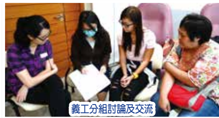
義工分組討論及交流

為鞏固義工與患者及家屬的溝通技巧，提升服務信心，17/6(六)特舉行「義工進階訓練課程及分享會」，讓義工認識更多社區資源及如何將所學的運用在服務中。義工互相分享服務經驗及感受，彼此交流及互相鼓勵，並表示活動內容豐富實用，加強日後參與服務的信心。