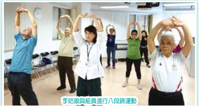
李姑娘與組員進行八段錦運動

本中心與職業治療部合辦「健身氣功」課程 (第四期) 已於五月開始，訓練班由考獲國家體育總局健身氣功管理中心專業資格之本院職業治療師指導。訓練課程以癌症康復者的身心復康為重點，透過訓練讓參加者能以八段錦運動來伸展筋骨，增強身體的抵抗力，而組員間互相交流分享，亦有助康復者身心復康。