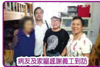
病友及家屬感謝義工到訪

病室及家居探訪服務一直受到病友及家屬的歡迎，不但紓緩中風患者在住院期間產生的不安及憂慮，亦為離院患者對中風後的生活技巧、社區資源、家居安全等多方面提供實質意見，加強患者與家屬對康復的信心。健康資源中心社工與新健社及慧進會朋輩義工合作無間，為患者與家屬帶來新希望。