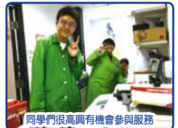
同學們很高興有機會參與服務

第一期計劃的完結,接著第二期亦於10/7-18/8開展,再有一批有心志醫療行業的未來社會棟樑到醫院參與義工服務,在此先感謝各病房及部門同事對義工的指導及照顧。