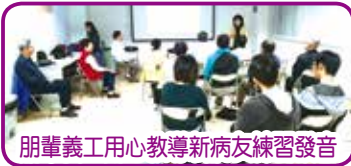
朋輩義工用心教導新病友練習發音

由新健社主領的「開心唱歌學講話」第四期在 8/6 (四) 已展開，朋輩義工繼續帶領這項具有特色、有意義的活動，透過輕鬆手法，學習基本發聲，一同大合唱，鼓勵中風患者嘗試發聲，改善講話能力，藉此提升自信心，並建立朋輩支持網絡。