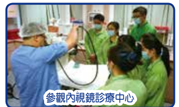
參觀內視鏡診療中心

「歡樂時間過得特別快!」這句說話是學生義工個別檢討時的回應。轉眼間由九龍東醫院聯網基督教聯合醫院及靈實醫院合辦,於20/5-30/6連續6星期進行的「暑期學生服務體驗計劃2017」第一期已經完結,健康資源中心社工在最後一週為40位參加計劃的學生義工進行檢討,大部份義工表示對醫療行業感興趣,透過各項參觀及專業醫療分享令自己對醫療工作增加不少認識,幫助自己認清未來工作的方向,亦有義工表示有機會學習關懷病人,並曾在病房遇過病人離世的情境,這次經歷是自己第一次近距離接觸死亡,這經驗讓自己體會到健康的寶貴及珍惜現在的重要。