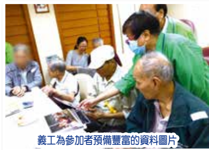
義工為參加者預備豐富的資料圖片

本年度香港紅十字會繼續參與本院寧養義工服務計劃，透過「懷緬小組」形式進行互動遊戲及分享。在20/4(四)舉行的「香港舊行業」活動中，參加者興高采烈地「話當年」，分享昔日拼命工作的辛酸及趣味，更藉以肯定他們對社會及家庭的付出。24/5(三)則以「懷舊小食」為主題，大家回憶起兒時小食時也感到非常懷念，娓娓道來兒時購買「飛機攞」的情景、「盂蘭勝會」熱鬧及特色小食。參加者在熱鬧的氣氛下享受了一個愉快的上午。