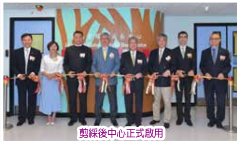
剪綵後中心正式啟用