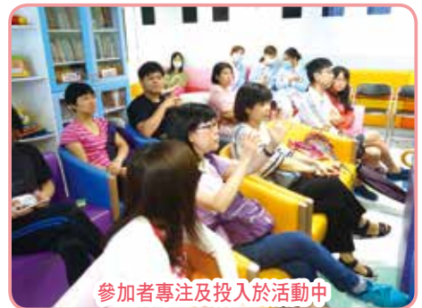
參加者專注及投入於活動中

參加者投入參與活動，不但踴躍發問，在分享時段積極分享照顧感受、交流資訊及互相關懷。