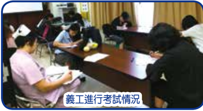
義工進行考試情況

20位參與嬰兒餵哺支援組(愛嬰大使)義工完成培訓證書課程後,已於10/6(六)及14/6(三)接受了筆試及實習評估,義工們認真面對是次考試,考試成績亦很理想,稍後會獲頒發課程證書,日後將投入嬰兒餵哺支援服務,與婦產科團隊攜手努力邁向「愛嬰醫院」的目標。