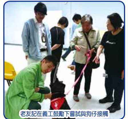
老友記在義工鼓勵下嘗試與狗仔接觸

亞洲動物基金的職員及義工於10/4(一)帶同2隻乖巧的「狗醫生」探訪精神科日間醫院的老友記,逗得他們開懷大笑,職業治療部同事亦透過遊戲講解有關狗的知識,氣氛熱鬧,老友記十分享受與「狗醫生」相處的時光。