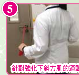
針對強化下斜方肌的運動

此運動需要橡筋帶協助，透過拉動橡筋帶達至強化菱形肌的效果，注意拉動橡筋帶時手要保持在水平的位置。