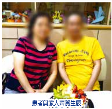
患者與家人齊賀生辰

每年的生日對健康的你意義是甚麼呢？是大肆玩樂的日子？是提示年紀漸長的日子？對於末期病者而言，能夠渡過每一天，能夠享受每一個節日意義重大！為此，寧養中心社工特於每季舉行「生的喜悅」季度生日會，讓患者在病榻中可享受喜悅與關懷，與家人渡過美好的時刻。願大家得著祝福，在患難的日子彼此扶持。