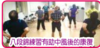
八段錦練習有助中風後的康復

5/6 (一) 展開了第三期的「氣功八段錦班」，慧進會的朋輩義工繼續擔任導師，帶領中風病友進行有系統的八段錦練習，鼓勵他們培養恆常運動的習慣，提升自我管理能力。下一期訓練將於 9 月進行。