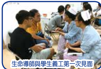
生命導師與學生義工第一次見面

5月期間,「南丁格爾生命導師計劃」各小組的生命導師及學生義工已見面互相認識,會面時導師向學生了解參加義工的原因,亦關心他們的讀書情況。至於學生義工亦與導師分享現時在醫院參與義工服務的經歷及感受,亦向導師表示讀書壓力很大,希望從導師身上學習減壓方法。雖然第一次短短的會面,大家未能深入詳談,但日後數個月的共處時間,大家必定有更多互相交流的機會。