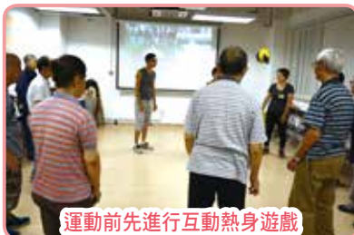
運動前先進行互動熱身遊戲

為期12節的第14期「自我管理運動班」已於5/4(三)展開，共有25位組員參加，大家在受訓之「過來人」義工帶領下學習及練習「太極十八式」。面對病患，患者在活動能力方面受到不同程度的影響，但他們卻積極參與活動，組員間更彼此關懷及鼓勵，發揮「同路人」互相扶持的果效。