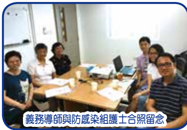
義務導師與防感染組護士合照留念

為配合本聯網醫院義工服務的需要,本部邀請了5位現職及退休護士同事擔任醫院義工防感染課程義務導師,5/6(一)特安排由防感染控制組護士講解,讓大家了解義工防感染課程教授的內容,各義務導師於7月份開始正式投入服務。