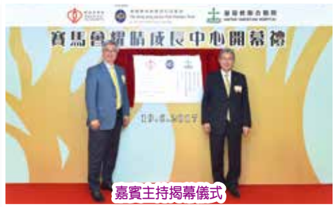
嘉賓主持揭幕儀式

獲香港賽馬會慈善信託基金慷慨捐助而設立的「賽馬會耀晴成長中心」，開幕禮已於 2017 年 5 月 19 日（五）順利舉行，社區協作夥伴、地區領袖及院內同事，合共 100 多人蒞臨參與。開幕禮邀得香港賽馬會董事楊紹信先生，JP 及醫院管理局主席梁智仁教授，SBS, JP 為紀念牌匾主持揭幕儀式；隨後聯同醫院管理局行政總裁梁栢賢醫生，JP、觀塘區議會主席陳振彬博士，GBS, JP、觀塘民政事務專員羅莘桉先生，JP、社會福利署觀塘區福利專員葉小明女士、基督教聯合醫院醫院管治委員會委員李國謙先生，MH 及九龍東醫院聯網總監徐德義醫生為中心正式啟用進行剪綵。李國謙先生，MH 更代表本院致送紀念品予香港賽馬會慈善信託基金，以表謝意。