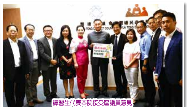
譚醫生代表本院接受區議員意見