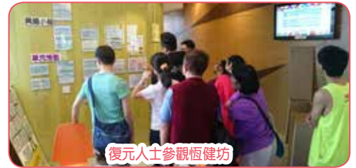
復元人士參觀恆健坊

本計劃是與精神科日間醫院合作的新項目，共有8節，16/5(二)健康資源中心社工以「自我照顧」為主題提升病友的自我照顧能力；第二節23/5(二)主題為「認識社區資源」，健康資源中心社工聯同精神科護士帶領8位復元人士參觀位於藍田的香港心理衛生會恆健坊，認識精神健康綜合服務中心的服務，希望幫助他們重融社區。