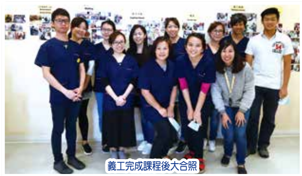
義工完成課程後大合照

23/4(日)舉行了「寧養義工訓練課程」，為11位現正就讀香薰治療文憑課程的學生及其導師進行訓練，透過課程讓參加者了解本院之寧養義工服務計劃、末期患者的情緒需要及義工角色等。此外，更透過課程讓義工學習如何對病者表達關心及給予支援，各參加者認真投入參與，課程後更表示對參與服務增添信心。