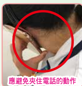
應避免夾住電話的動作

· 問：可否教授讀者們一些有效的運動以預防或減輕使用手機或平板電腦對身體的傷害？