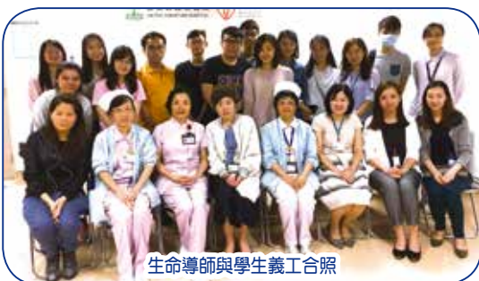
生命導師與學生義工合照