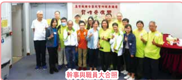
幹事與職員大合照

每年一度的康寧腎友會會員大會暨健康講座已於20/5(六)順利舉行，有接近百人出席。是次健康講座以「腎性骨病變」為題，邀得陳梓醫生親臨主講。參加者從講座中了解到腎臟與人體骨骼有著密不可分的關係，並學習到腎臟如何發揮平衡體內礦物質及維持骨骼健康的角色，病友及其家屬踴躍參與討論。而2017-19年度之幹事亦已於會員大會順利選出，新一屆的幹事們將一如既往，盡心盡力地為同路人服務。