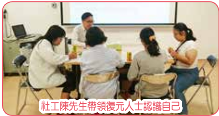
社工陳先生帶領復元人士認識自己

新一期「復元『支』友」計劃，由健康資源中心社工帶領的6節活動已於6月份進行了3節，有4位復元人士出席參與，大家都很投入分享，希望此計劃能幫助他們提升對自我的認識，發現自己的強項，從而更有效實踐復元的概念，在人生的起伏中成長。