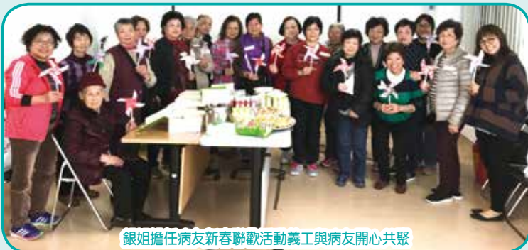
銀姐擔任病友新春聯歡活動義工與病友開心共聚