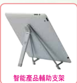
智能產品輔助支架

另外，在運用這些產品時，讀者也可以多留意身邊的環境，如：房間的大小、光源的位置與強度、眼睛與智能產品之間的位置(包括距離及高度)等，如有需要，也可考慮是否需要配合輔助支架一起使用。而值得讀者留意的是，由於智能手機一般較薄，大家應該避免在使用時以耳及肩膀夾住電話的動作，以免令頸部的肌肉過份繃緊。