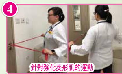
針對強化菱形肌的運動

先找一個較空曠的位置，前弓後箭站穩，左手向後扶牆，手臂呈90度角，如想效果更明顯，可慢慢轉動身體(見圖)，左右手輪流做。