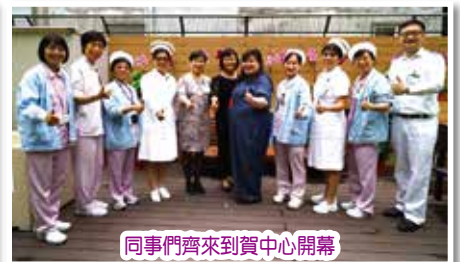
同事們齊來到賀中心開幕