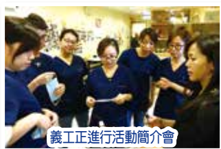
義工正進行活動簡介會

面對末期病患，患者在身體上承受不同程度的不適及痛楚，容易造成睡眠欠佳、社交生活障礙及情緒困擾。為紓緩以上的不適，10多位現正就讀香薰治療課程及剛完成義工訓練課程的義工在寧養義工服務計劃社工的籌備下，在23/4(日)舉行「痛症紓緩工作坊」。義工們利用天然及低敏的精油為患者進行按摩，並教導家屬掌握按摩技巧，紓緩患者的不適及促進家人與患者之間的溝通。參加者對活動反應正面，而義工們更感能夠學以致用，運用所長服務病患者外，更可在過程中加深對末期病者的了解，並送上適切的關懷及鼓勵。