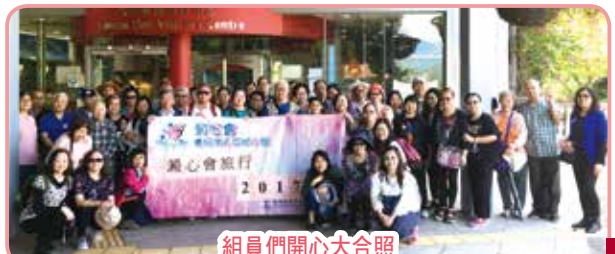
組員們開心大合照

29/4(六)舉辦了澱心會2017春季旅行，地點包括青馬大橋觀景台、屯門新生互動農場、深井嘉頓展覽館及流浮山海鮮午餐。大家暫時放下病患的憂慮與壓力，開開心心、輕輕鬆鬆地共渡了愉快的一天。