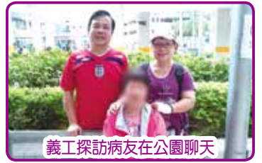
義工探訪病友在公園聊天