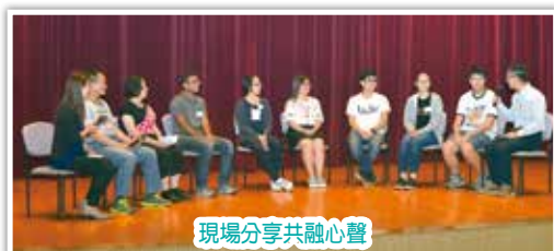
現場分享共融心聲

最後，和大家講個例子，我在社區有三百多個義工，其中一個義工，他太太帶他來時，向我說他有些精神問題。我說，交給我，我也有向人透露過他的情況，他非常投入義工的服務，現時已是義工領袖。」