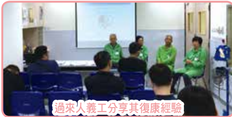
過來人義工分享其復康經驗

6/6(二)及13/6(二)舉行「心律不正工作坊」，講者與病人有機會作深入的傾談，可以更了解病人手術後的生活狀況。