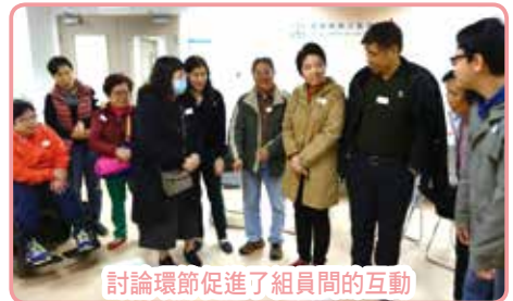
討論環節促進了組員間的互動

小組於1/4(六)舉行了以「職場就業」為主題的分享會，當日共有12位組員及家屬參與，參加者透過活動分享因病患帶來的負面影響，而健康資源中心社工更透過互動方式引導他們抒發負面情緒，促進參加者互相鼓勵。分享會後，組員表示分享會能夠提供機會讓他們認識更多「同路人」，並能互相鼓勵及支持，在復康路上得到正能量。