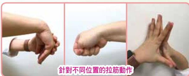
針對不同位置的拉筋動作

· 答：雖然單就低頭的動作，並沒有研究指出使用多久才休息會比較恰當，不過在運用智能電子產品時，除了手部，很多時也與眼部有關，所以我們建議可以參考保護眼睛的法則“20-20-20”，即使用20分鐘後作休息，望20公呎以外的事物20秒。套用在運用智能電子產品也一樣，病人可於20分鐘轉換動作，並就身體不同部位做20秒拉筋動作，從而減低身體受電子產品的影響。