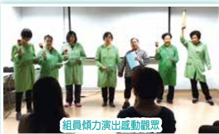
組員傾力演出感動觀眾

「音樂鬆一鬆」治療小組定期於癌症病人資源中心舉行，組員不但透過音樂紓緩其緊張和擔憂情緒，更學會以生命影響生命來激勵其他癌症病人。最近組員用心地改編樂曲和歌詞，並排練了一場小歌劇來分享她們抗癌路上的故事，藉此鼓勵其他病人勇敢和積極面對治療，並向一班年青的暑期義工作表演，以自身經驗為年青人帶來鼓勵。