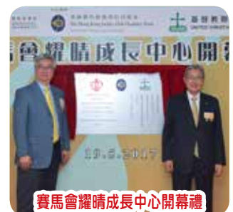
賽馬會耀晴成長中心開幕禮