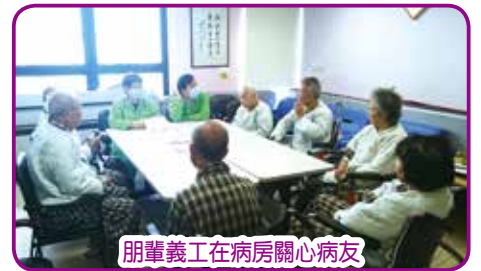
朋輩義工在病房關心病友

患者在中風後的身體機能及活動能力普遍受到一定程度的影響，不但造成生活上的不便，也會造成心理阻障，影響社交生活，甚至缺乏信心回復昔日的生活模式。有見及此，健康資源中心社工夥拍慧進會朋輩義工在病房進行「生活技巧分享會」，藉著過來人義工分享康復的心路歷程及實際的生活技巧，加強病友們面對康復治療的信心。