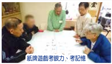
紙牌遊戲考眼力、考記憶